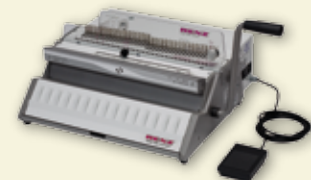
SRW 360 comfort / eco 360 comfort

In nur 3 Minuten vom manuellen zum elektrischen Stanz- und Handbindegerät umgebaut.