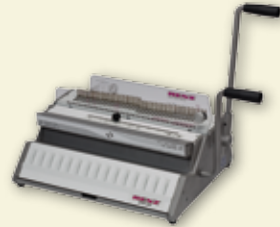
SRW 360 / eco S 360

In nur 3 Minuten vom manuellen zum elektrischen Stanz- und Handbindegerät !